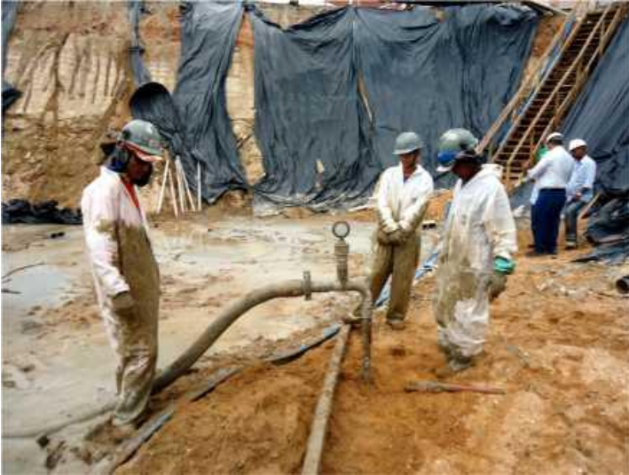
Execução do Permeation Grouting